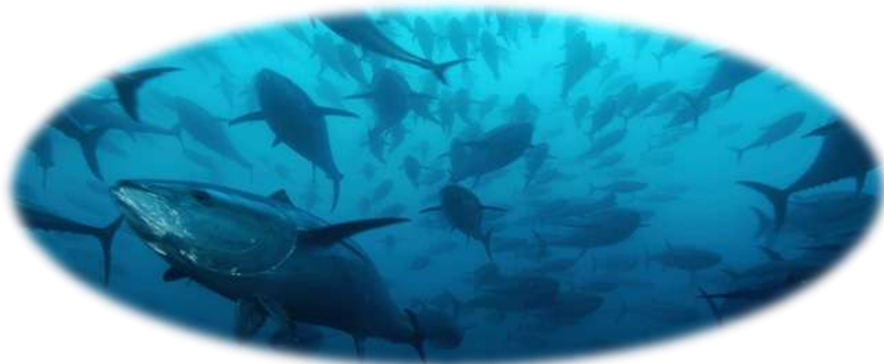
(Cardumen de atún nadando libremente, en alguna parte del océano)

La forma de lucha que adoptemos debe ser muy diferente a la que utilizan lxs ambientalistas, partidos políticos, etc. si bien sabemos que algunos de los métodos que adoptan son efectivos en determinados casos, muchas de las veces son incompatibles con una perspectiva antiestatal, antiautoritaria, quizá sea hora de volcarse a una luchar ajena al sistema dominador, es decir salvaje, con ataque, tal como lo hace cualquier animal cuando se ve amenazadx, sin temor a ser una pequeña manada, obviamente será desde la civilización, pero entendiendo que algunas veces algo podremos lograr, y otras simplemente responder al ataque.