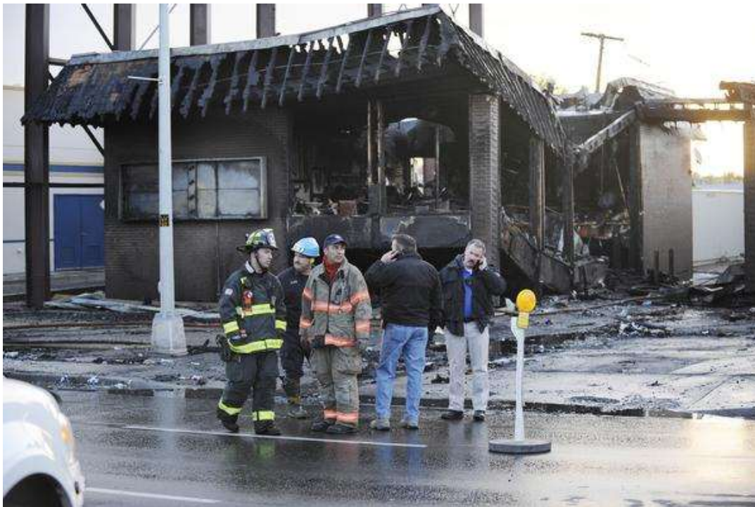
Uno de los objetivos del “lobo solitario”, una fábrica que utilizaba piel de ovejas.