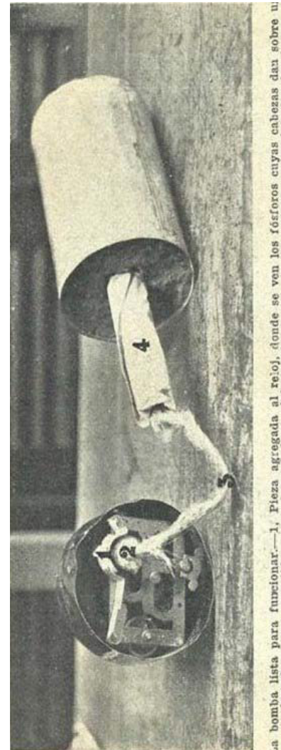
...a bomba lista para funcionar.—1. Pieza agregada al reloj, donde se ven los fósforos cuyas cabezas dan sobre un frotador 2, y encendidos comunican el fuego a la mecha 3, que a su vez lo transmite a la bomba 4.

Hartxs de la estéril crítica a lxs domesticadxs malvivientes que nos roban