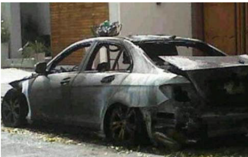
Una de los tantos automoviles de alta gama quemados, por lxs Amigxs de la Tierra, afines a la FAI/FRI