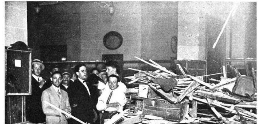
Foto del atentado al City Bank, en Buenos Aires el día 24 de diciembre de 1927

Escrito de Di Giovanni para Renzo Novatore luego de su caída en combate