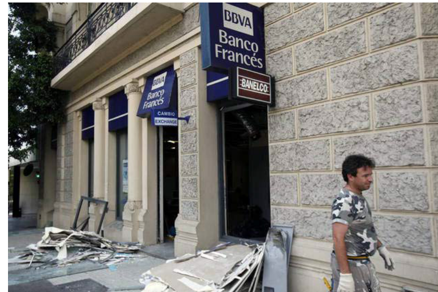
Foto de la entrada del Banco Francés, luego de “la visita” de la Brigada Andrea Salcedo en la madrugada del 4 de agosto de 2010.