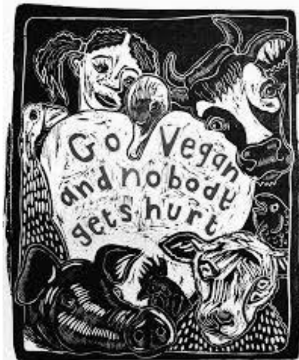
Imagen de Sue Coe; "Hacete veganx y nadie sale heridx"

Estamos acostumbradxs a que lo normal sea el consumo de animales. Pero porque no salir de lo normal? Razones como verán las hay, excusas no las hay, información no falta. Que falta entonces? Pues salir de nuestras cómodas costumbres e introducirse en el maravilloso mundo del veganismo. Una práctica libre de crueldad y esclavitud, una práctica que aspira a la libertad de todxs lxs seres, a la libertad de la naturaleza, a nuestra propia liberta