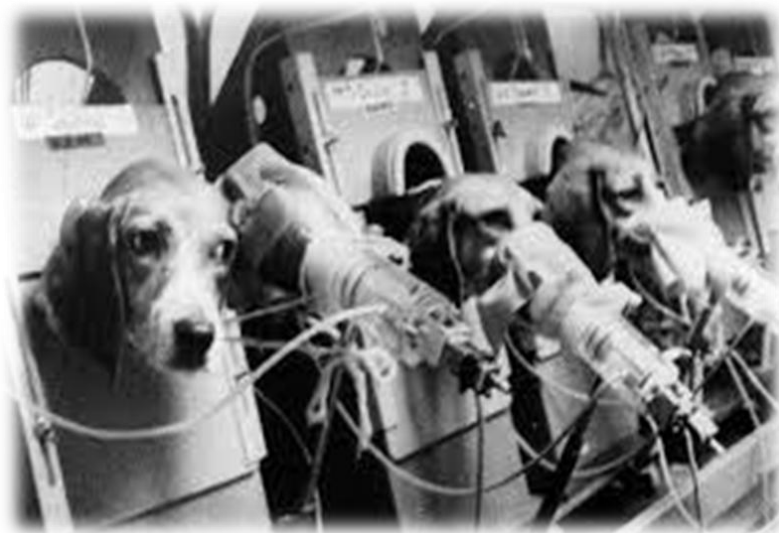
ANIMALES SUFREN Y MUEREN PARA ALIMENTAR TU ADICCIÓN

Al fumar estas creando un mal innecesario a miles de animales que ni te hace bien a ti.